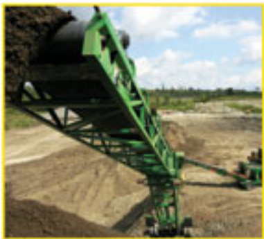
Direkt gekoppelter Hydraulikantrieb.